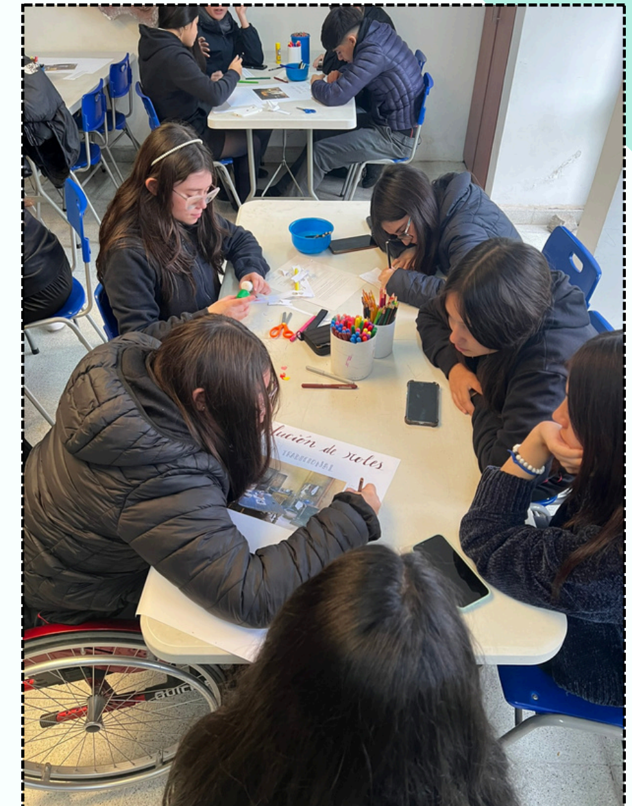
Taller espacios femeninos, espacios masculinos. Mayo 2025

Beneficiarios: 7.402 personas, representando un 31% más que en 2024.