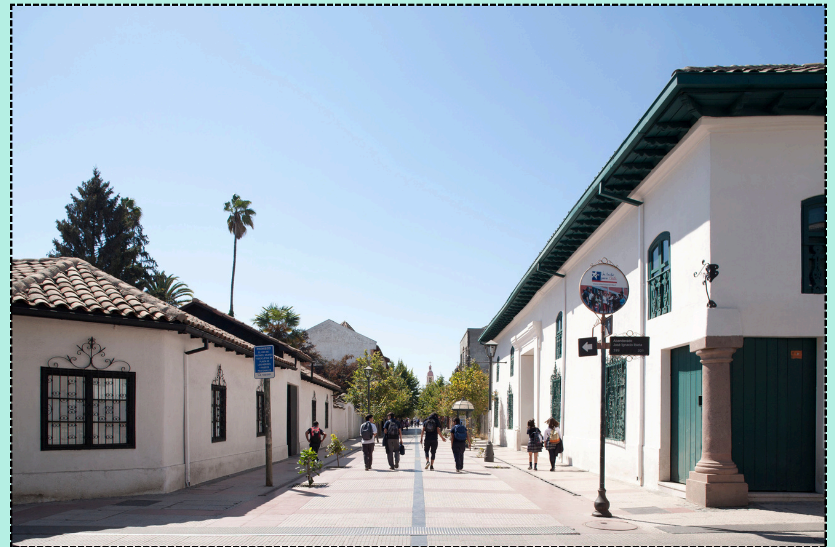
Museo Regional de Rancagua, 2013

“Nos visualizamos como un lugar donde el visitante pueda conocer la historia regional y su interacción con el territorio nacional. Nos proyectamos como un espacio inclusivo, de diálogo, investigación e interacción con las comunidades y el Patrimonio Cultural que resguardamos; como un organismo difusor del mismo, donde se dé cabida a las diversas manifestaciones culturales que conviven en la región, valorado por las comunidades como generador de desarrollo regional”