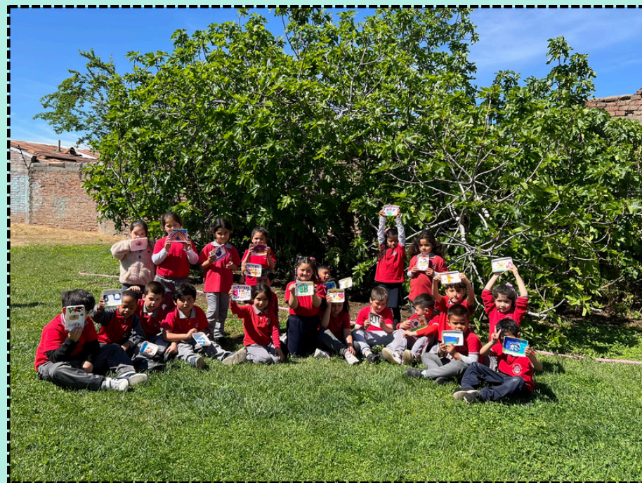
Taller Grandes Artistas, octubre 2025