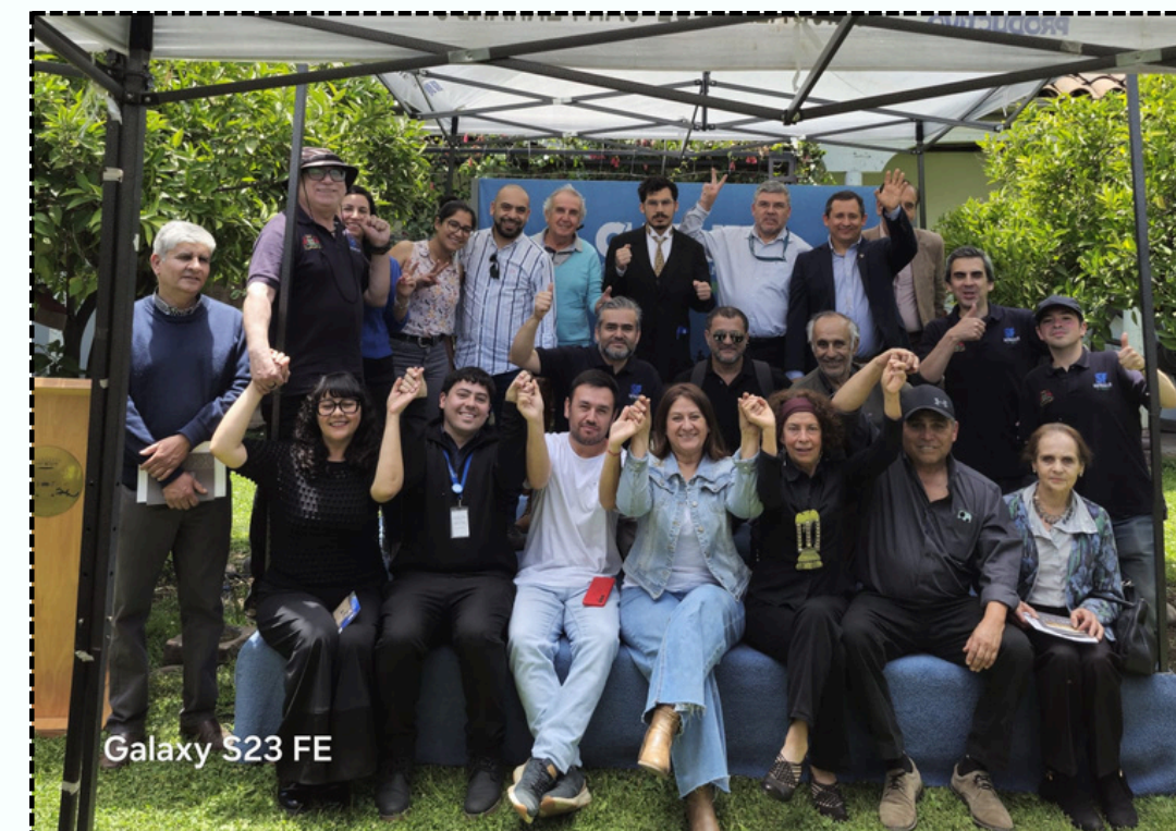
Red de Museos O'Higgins , noviembre 2025