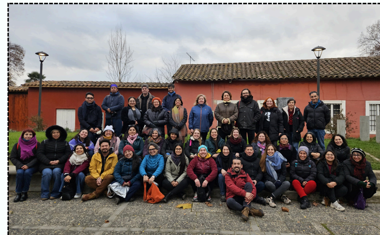
Educadores de museos, junio 2025

En la jornada se inauguró una exhibición colectiva, se brindaron reconocimientos y espacios de camaradería entre los distintos museos de la red. La actividad fue coordinada y ejecutada por el Museo Lircunlaut de San Fernando.