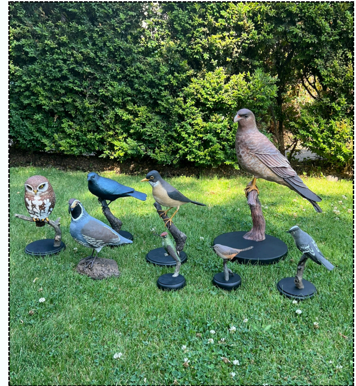
Réplicas de aves para uso didáctico

Durante 2025, se efectuó la etapa de investigación sobre las aves, la adquisición de paneles museográficos y de 7 réplicas de aves para uso didáctico.