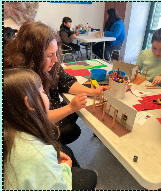
Taller retablos coloniales, junio 2025